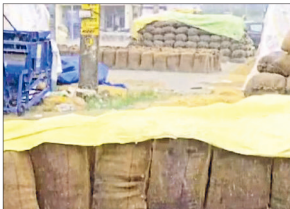
अंबाला। शहर की अनाजमंडी में बरसात में भीगाता धान।

पश्चिमी विक्षोभ के कारण मौसम तेजी से बदल रहा है। सोमवार को अचानक हुई बरसात की वजह से शाम को ठंडक ने दस्तक दे दी। ठंडी हवाएं चलने से लोगों को ठंड आने का अहसास हो गया। बरसात की वजह से मंडियों में पड़े धान को एक बार फिर नुकसान हुआ है। हालांकि किसानों की ओर से खेद के संस्थानों के जरिए धान को बरसात से बचाने के लिए हर संभव प्रयास किया गया। इसके बावजूद कई जगह धान बरसात की वजह से गीला हो गया। गौरतलब है कि सोमवार को अंबाला समेत कई जिलों में मूसलाधार बारिश का अलर्ट था। सुबह से ही अचानक यहां मौसम ने करवट ले ली थी। बूंदबांदी के बाद अचानक तेज बरसात ने ठंड का अहसास करवा दिया। बारिश का असर अंबाला