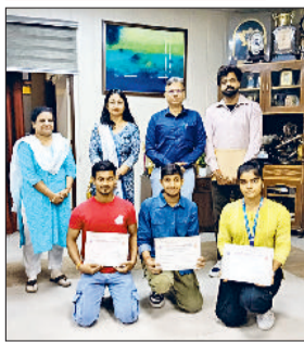
प्रतियोगिता में अव्वल रहने वाले छात्र।