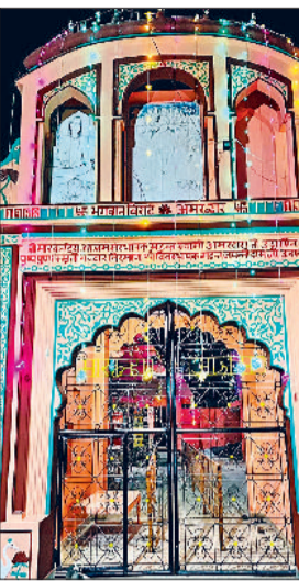
बराड़ा। मारकंडेश्वर मंदिर के प्रवेश द्वार की फोटो।

गांव तंदवाल-हरयोली की सीमा पर स्थित पवित्र मारकंडेश्वर मंदिर में मंगलवार से पारंपरिक दो दिवसीय मेला विधिवत रूप से शुरू होने जा रहा है। मेले की सभी आवश्यक तैयारियां पूरी कर ली गई हैं। मेले में मथा समिति आने वाले श्रद्धालुओं के स्वागत के लिए मंदिर कमटी व प्रशासन ने संयुक्त रूप से व्यवस्थाएं सुनिश्चित की हैं। हर वर्ष की तरह इस बार भी यह मेला श्रद्धा, भक्ति और उत्साह के वातावरण में मनाया जाएगा। पिछले दो- तीन दिनों से दुकानदार मेले में अपनी दुकानों को लगाने पहुंच चुके थे। मेला समिति की ओर से मेले में आने वाले श्रद्धालुओं को असुविधा न हो, इसके लिए सभी मार्गों को दुरुस्त किया गया है। इसके इलावा मेले में बिजली, पेयजल तथा सफाई की विशेष व्यवस्था की गई है। कमटी के सदस्यों ने बताया कि मेले में शाम को हरियाणवी सांग व कुश्ती दंगल का भी आयोजन किया जाएगा, जिसमें कई नामी पहलवान अपना दमखम दिखाएंगे। बता दे कि इस मेले में प्रदेश के साथ-साथ हिमाचल, पंजाब और उत्तर प्रदेश के सुदूर इलाकों से बड़ी संख्या में लोग