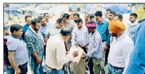
यमुनानगर। निरीक्षण के दौरान जांच करते हुए मुख्यमंत्री उड़नदस्ते की टीम।