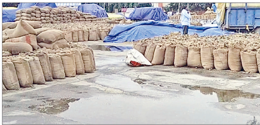
कुरुक्षेत्र। थानेसर अनाज मंडी में खुले आसमान के नीचे पड़ी धान से भरी बोरियां।

मंडियों में सड़कों पर जहां पर भी नजर जाती है वहां पर धान ही धान नजर आ रहा है। मजदूर दिन भर धान को सुखाने में लगे रहते हैं। हालात ऐसे हो गए हैं कि मंडी में किसान जिन ट्रैक्टर-ट्रालियों में धान लेकर आ रहे हैं उन्हें भी आदती तक जाने की जगह नहीं मिल रही। इससे ट्रैक्टर-ट्रालियों व ट्रकों को धान के ऊपर से ही ले जाया जा रहा है।