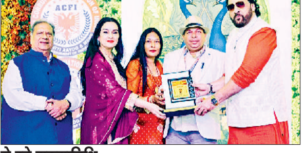
ये रहे मुख्यातिथि