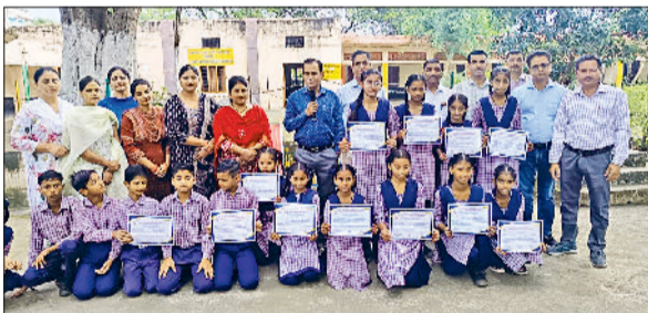
नारायणगढ़। बाजी मारने वाले छात्रों के साथ शिक्षक।