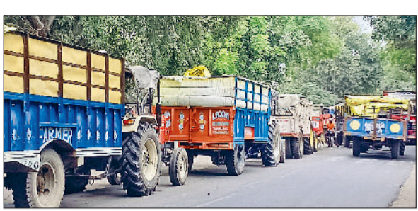
तरावड़ी। मंडी के बाहर सड़कों पर ट्रालियों का लगा जाम।

मंडी में मौजूद आदतियों ने बताया कि बरसात से अनाज खराब होने का खतरा बढ़ गया है। वहीं, फसल लेकर मंडी पहुंचने वाले किसानों को कई किलोमीटर लंबा जाम झेलना पड़ा। सड़कों पर ट्रालियों की लंबी कतारें लगी रहीं। जानकारी के अनुसार, सरकारी पोर्टल की धीमी गति के कारण किसानों के गेट पास कटने में देरी हो रही है। इससे मंडी में प्रवेश बाधित रहा और ट्रैफिक व्यवस्था चरमपरा गई।