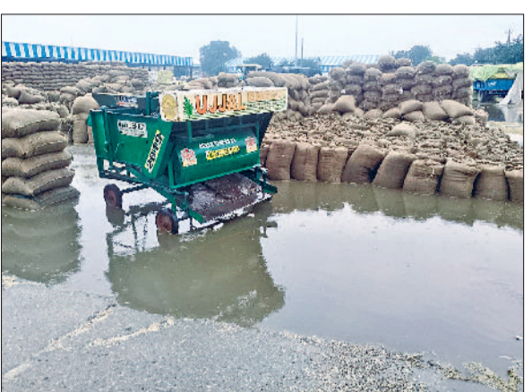
तरावड़ी। अनाज मंडी में बरसात से भीगी धान की बोरियां।